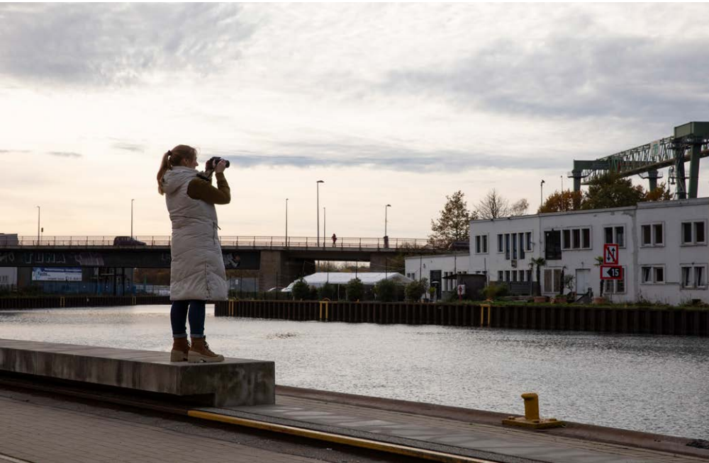
Workshop Landschaftsarchitekturfotografie 2025, Hafenquartier Dortmund

Professionelle Fotografie für Landschaftsarchitekt*innen mit unter- schiedlichen Vorerfahrungen in der Fotografie