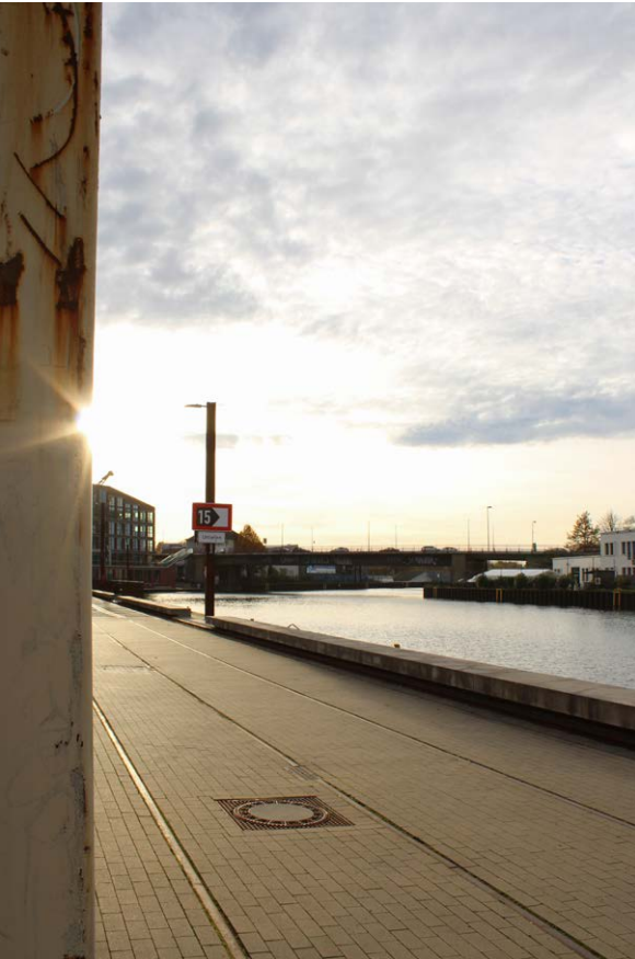
Workshop LA-Fotografie 2025, Hafen Dortmund